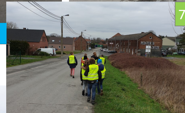
Le chemin monte !