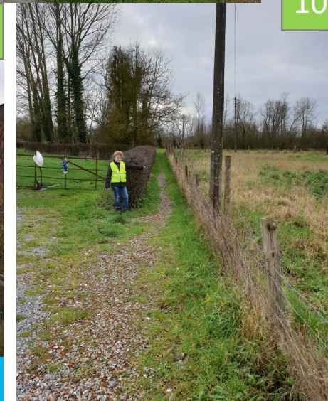
Vers Piedsente Masson